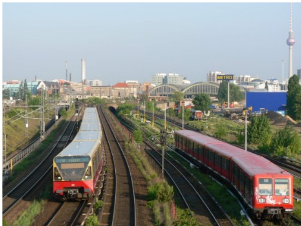
Blick von Warschauer Str. zum Ostbahnhof

Denn selbst für den, der Berlin schon kennt, wird es viel Neues geben: