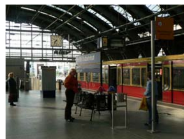
Treffpunkt Bst. 8/9, Ostseite, Ostbf.

Treffpunkt 10 Uhr, Ostbahnhof, Bst., 8/9 (S-Bstg. Ri. Osten), östliches Bahnsteigende.