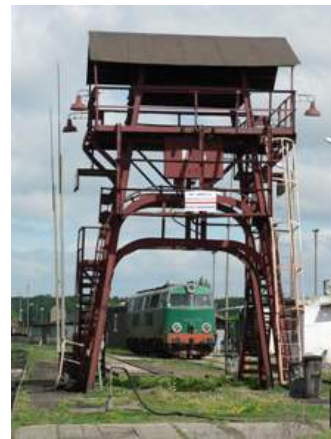
Im BW Kostrzyn

Rückfahrt auf direktem Weg über Angermünde.