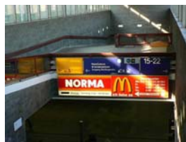
Bf. Lichtenberg. Vom S-Bahnsteig hinterer Ausgang nach links in die Halle zum Treffpunkt

Treff: 9.15 Bahnhof Lichtenberg (S5, S7, S75, U5) in der Halle vor dem Reisezentrum. (Ri. Ausgang Weitlingstr.)