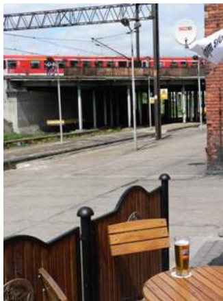
Bahnhof Kostrzyn mit RB aus Berlin

Fahrt mit dem Regionalbahn nach nach Küstrin (Kostrzyn).