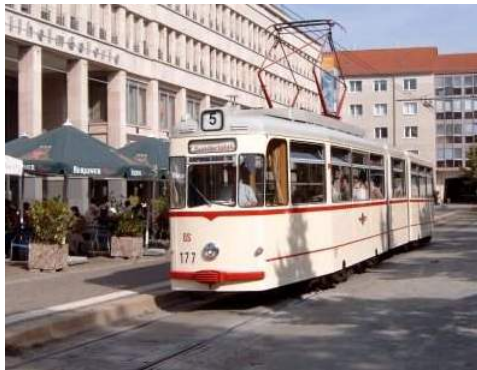
Gotha-Gelenktriebwagen in Potsdam

Zweistündige Stadtrundfahrt mit einem Gotha-Gelenktriebwagen (Bild links) und einem 2-achsigen-Gotha-Triebwagen + Beiwagen im Potsdamer Straßenbahnnetz